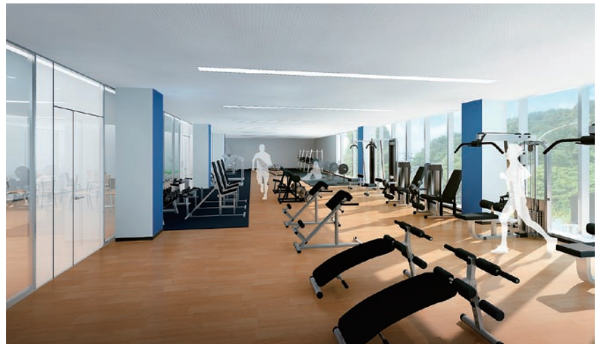
自然光の有効利用、人感センサーによる自動照明制御、節水型機器の採用など、省エネルギーに配慮した設計計画となっている。