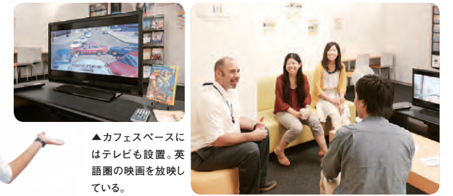
▲カフェスペースにはテレビも設置。英語圏の映画を放映している。

追大生同士、または留学生との出会いと交換の場。コーヒーを飲みながら、気軽に英語の世界に一歩足を踏み入れてみるスペース。まずはこの場所で英語にトライする気持ちをもって楽しんでほしい。また、弁当などの持ち込みも許可されているので、ランチをしながら英語の会話を楽しむのもOK。ただし、お茶だけ飲みにくる人は「No, thank you」。