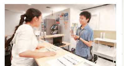
▲カウンターで「E-CO」の事を教えてくれるのは、「E-CO-to(いいこと)」と呼ばれるボランティアグループ。学年、学部を問わず仲良くE-COを盛り上げてくれる。

4月にオープンしたEnglish Café at Otemonを広報スタッフが訪ねた。そこには「英語学習の場」と意気込まずに、カフェにいくような感覚で気軽に利用できる雰囲気があった。コトは、リラックスして、英語とコーヒーを楽しむこと。わからないことがあれば親切なラーニングアドバイザーが助言してくれる。