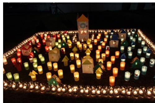
キャンドルオブジェ