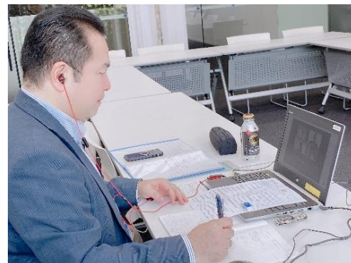
講師がWEB面接を行う様子

秋学期以降は、新型コロナウイルス感染拡大の状況を見ながら、対面での講座も開催。業界説明会や企業研究のための講座を実施し、引き続き就職活動を支援していきます。