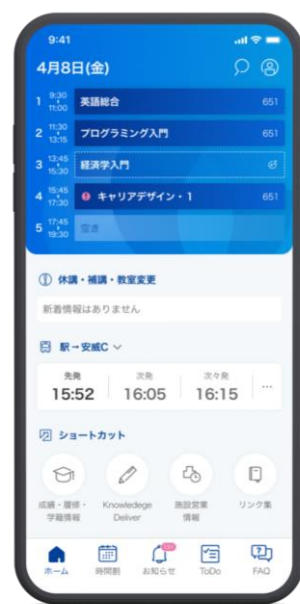
大学公式アプリ「OIDAI アプリ」